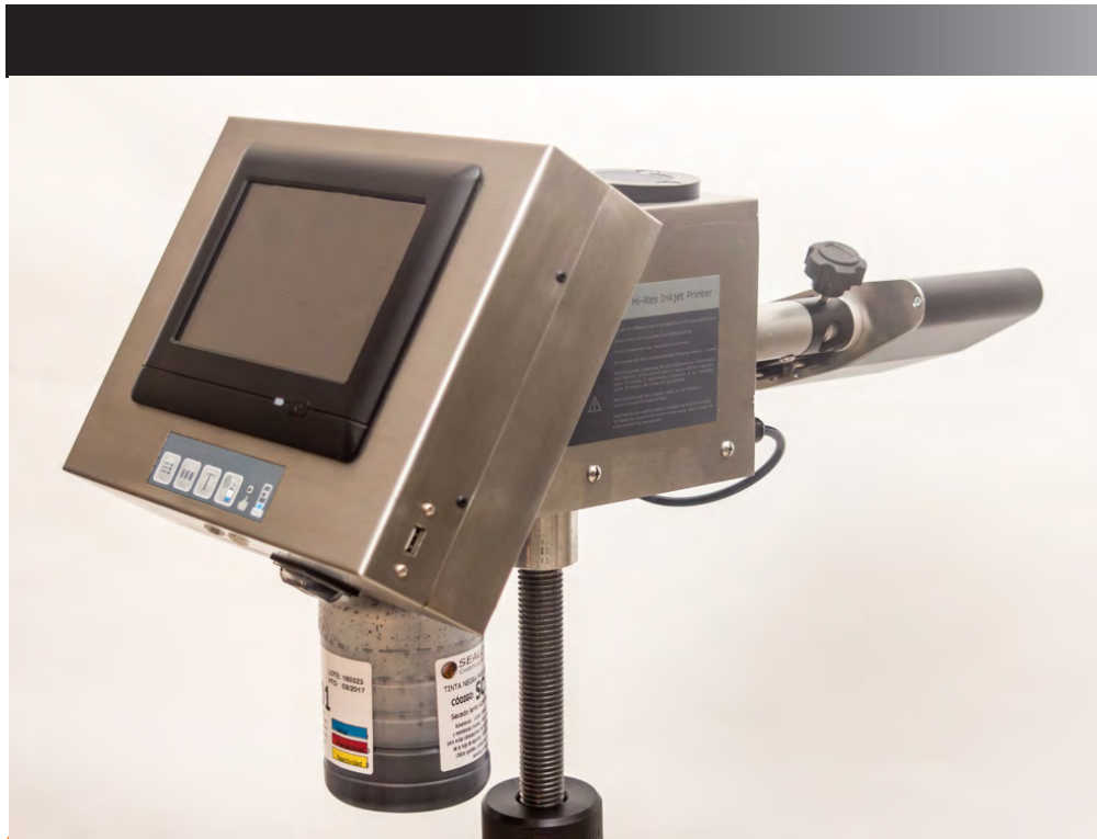
PANTALLA TOUCH SCREEN